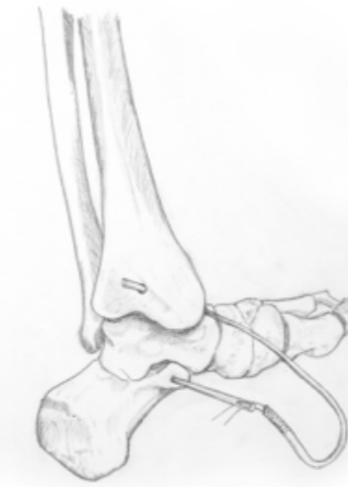
Figur 1. Principskiss medialt där sengraft med ledare dras igenom borrhålning i calcaneus. Ersätter TCL. Interferensskruv sätts i mediala malleolen och medialt i calcaneus i samtidig tension från lateralsidan och foten i plantegrad ställning.

Prospektiv randomiserad studie (Total subtalär instabilitet) mellan sentransfer och ligamentrekonstruktion med ordinär vävnad har godkänts av Ethiska Kommitén i Lund och kommer igångsättas snarast.