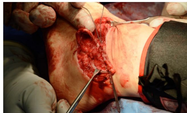
Figur 5. Slutresultat lateralt. Trådarna återfäster FTA och CF-ligamentet mot rå benytta.