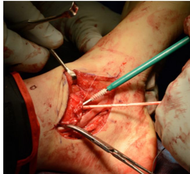
Figur 2a. Interferensskruven sätts i mediala malleolen.

Då jag har tyckt att det har varit svårt att rekonstruera ligamenten så att de håller med denna omfattande instabilitet, har jag utvecklat en metod där jag ersatt det tibioacalcanära ligamentet (TCL) (se Fig 1, 2a, 2b och 3), samt det calcaneofibulära ligamentet (CFL) (se Fig 4, 5 och 6) med hamstringsgraft. Bägge ledbandet guidar foten i rotation, och är isometriska, med stora krav på riktningen på TCL som ligger i spänn hela rörelseområdet. Denna metoden är ny, med samtidig rekonstruktion medialt och lateralt vad gäller subtalära ligament.