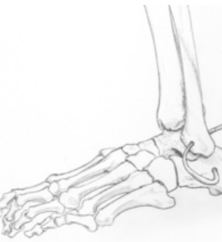
Figur 4. Översikt lateralt där graftet ersättes CF-ligamentet. Interferensskruv genom laterala malleolen medan senan spänns upp med plantegrad fotled.