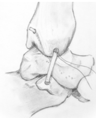
Figur 3. Slutresultat medialt. Trådarna i mediala malleolen används för återfästning av TibSpring, TibNav och TC-ligamentet. Lutningen på TCL är ca 20 grader framåt